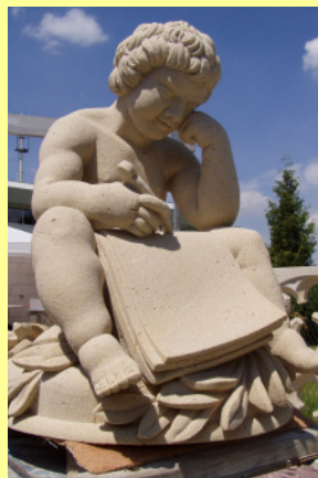
Prüfungstück M. Faust Steinbildhauermeister

Die Prüfung im Teil II findet in der letzten Ausbildungswoche im Dezember statt und erstreckt sich über drei Tage. Für die Arbeitsaufgaben des Teil I stehen die Steinmetzschauer der Sächsischen Steinmetzschule zur Nutzung bereit.